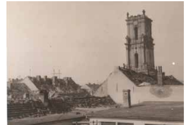
Turm der Garnisonkirche nach der Bombardierung am 14.04.1945

Mi. 10.06. 19 Uhr Vortrag zur Friedensethik Dietrich Bonhoeffers von Prof. Dr. Wolfgang Huber, Bischof a.D.